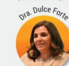
Diretora da Associação Economia Solidária e Sustentável e autora do livro "Como gerir o meu dinheiro"