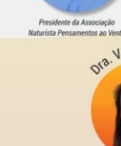
Educadora de Infância e Professora de Yoga