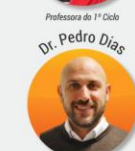
Coordenador Técnico para o Futebol de Formação