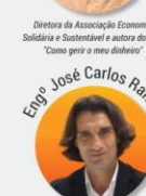
Empresário e Diretor de Franchising da Explicolândia