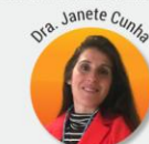
Professora do 1º Ciclo