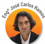
Diretor de Franchising da Explicolândia