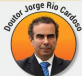
Professor Universitário, Doutorado em Ciências Sociais e autor dos livros "Pais à Beira de um Ataque de Nervos", "Este ano vais ser o melhor aluno! 'Bora Lá?'" e "Do Secundário à Universidade com Sucesso – 'Bora lá?'"