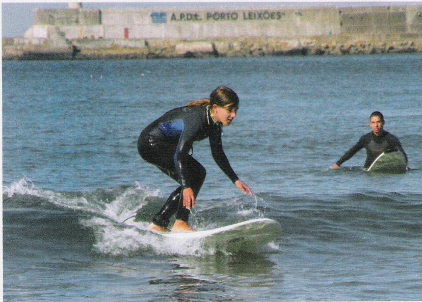
Escola de Surf do Norte, para os mais radicais.

para desenvolver a coordenação dos mais pequenos, e os cursos livres ou oficiais, onde se aprende a tocar instrumentos como piano, guitarra, bateria e violoncelo.